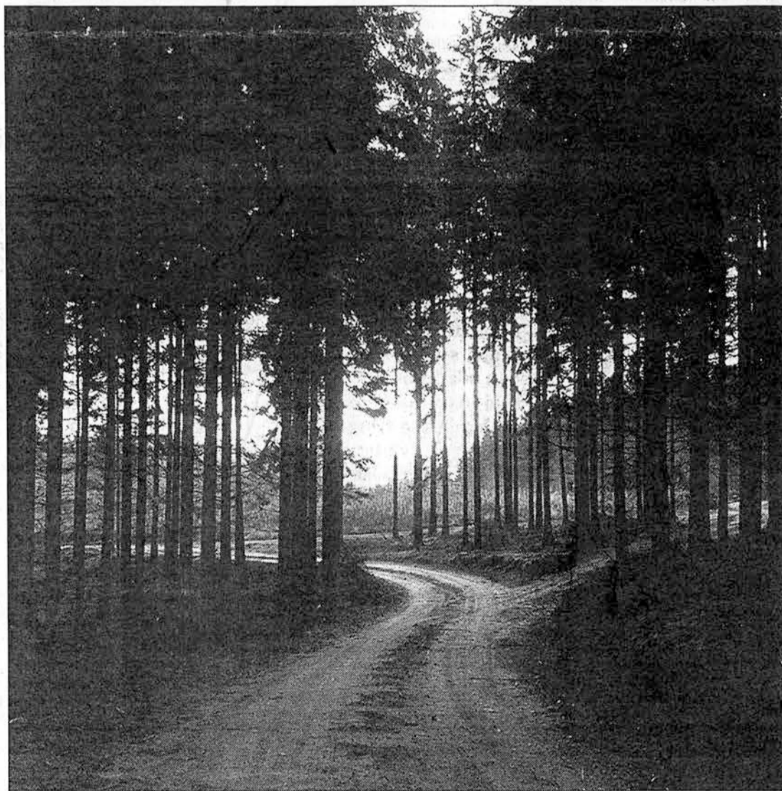
Sedan de äldsta fotografierna togs har platserna förändrats.