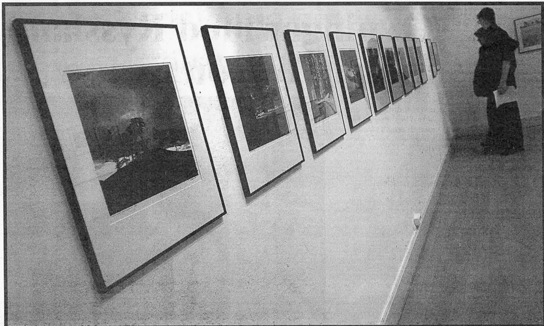
"I mitt Halland". Fotografen Christer Järeslätt visar med svartvita fotografier hur han har upplevt sitt landskap under tjugo år.